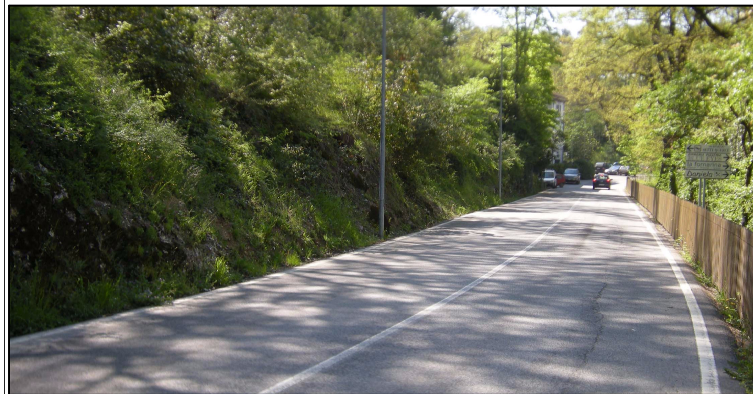
TAV.01: planimetria generale