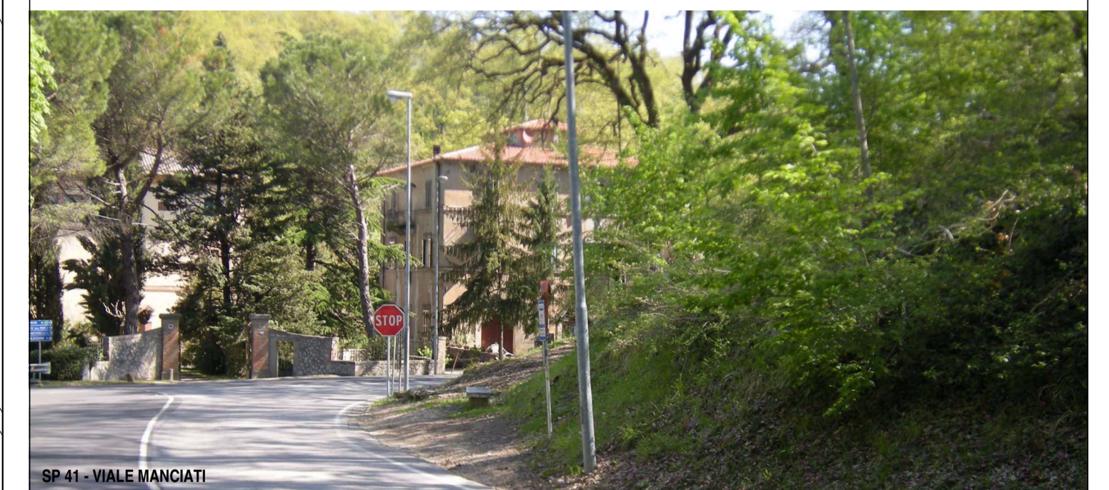
SP.41 - VIALE MANCIATI