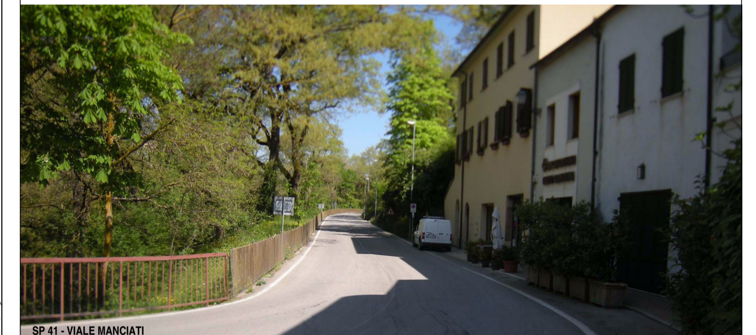
SP.41 - VIALE MANCIATI